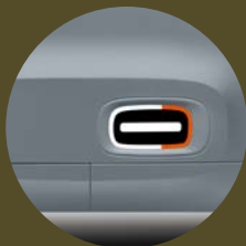
GÉLULES DE PORTE