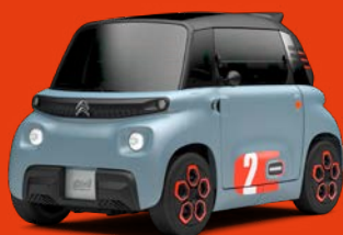
MY AMI POP