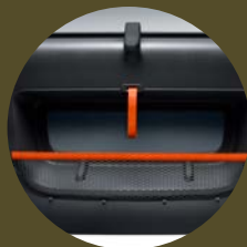
FILETS DE PORTE