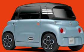
MY AMI BLUE