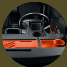
BACS DE RANGEMENT