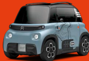
MY AMI VIBE